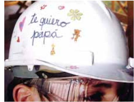
Helse og sikkerhet på arbeidsplassen kan presenteres på mange måter.

gjennomsnittlige månedslønnen for fast ansatte 408 736 CLP og 293 479 CLP for midlertidig ansatte, se tabell. Cermaq vil fortsette å tilby konkurransedyktig begynnerlønn og verdsetter ferdigheter, kompetanse og ansiennitet i vårt avlønningssystem.