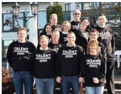
Cermaqs talentprogram bygger framtidig lederskap.