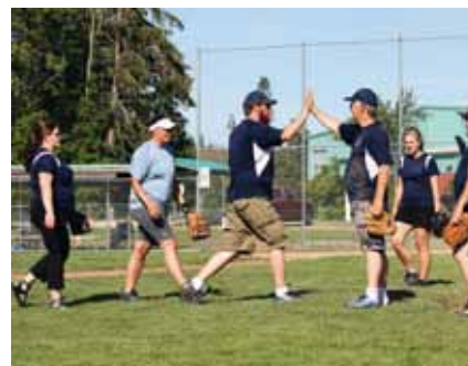
Mainstream-team på banen.