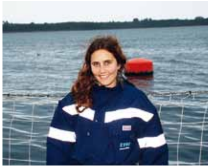
Cermaq fremmer like arbeidsmuligheter og tilbyr gode og konkurransedyktige arbeidsforhold.

Lønnsnivåer, spesielt i foredlingsanlegg i Chile, har historisk sett fått oppmerksomhet og bekymring fra noen interessentgrupper. Ved slutten av 2009 var den laveste begynnerlønnen 211 080 CLP per måned sammenlignet med den myndighetsfastsatte minstelønnen på 165 000 CLP. Ved årets slutt var den veide