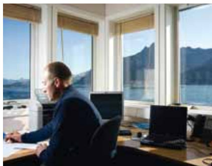
Et oppdrettsanlegg byr på fantastisk utsikt.