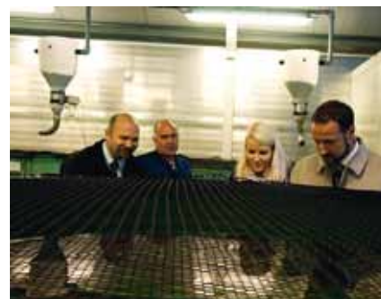
Kronprinsen og Kronprinsessen på besøk hos EWOS Innovation.

Ernæring – medfører en stor utfordring når det gjelder å finne et bredere utvalg av alternativer som kan benyttes som råvarer og være en erstatning for fiskemel og fiskeolje. Å utforme konsekvensmodeller av ulike valg gir større fleksibilitet for innholdsformulering og -spesifikasjonene i våre fôr.